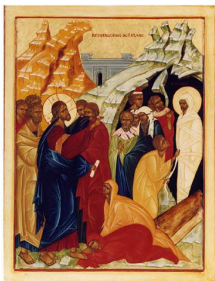
MAISON de LAZARE ®